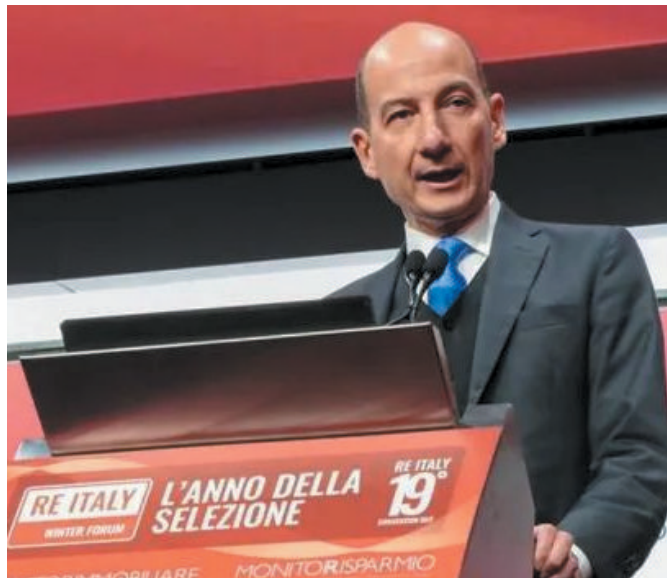
Il presidente di Confedilizia, Giorgio Spaziani Testa, a Re Italy

«La direttiva europea sull'efficienza energetica degli edifici è dannosa per l'intero settore immobiliare italiano, anche per quei soggetti che pensano di poterne trarre qualche vantaggio. Come diciamo ormai dal 2021, si tratta di un provvedimento sbagliato in radice nel momento stesso in cui obbliga, anziché incentivare, la realizzazione di alcune tipologie di interventi». Lo ha detto Giorgio Spaziani Testa, presidente della Confedilizia, intervenendo a Milano nell'ambito di Re Italy, la convention annuale dell'immobiliare. «I rischi sono gravi e diversi», ha proseguito, «deprezzamento generale degli immobili (non solo di quelli non energeticamente efficienti ma, a cascata, anche degli altri), con ricadute negative sui consumi; rischi per il settore bancario; aumento dei prezzi per tutti i lavori edili; fermo dell'essenziale opera di miglio-